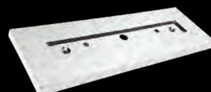
PIASTRA INSTALLAZIONE INSTALLATION PLATE