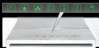
BOCCA DI EROGAZIONE A CASCATA SMART SMART WATERFALL SPOUT

Tutte le bocche di erogazione della collezione Waterfall Spout sono garantite da Stilopress 5 anni su difetti di fabbricazione, sulla cromatura e su difetti e/o vizi meccanici. Stilopress dichiara e garantisce che gli stessi superano i seguenti test: 200 h di NSS e/o 8 h di CASS secondo norme ASTM B 117/97 DIN 50021 SS- UNI ISO 9227 NSS; Shock Termico e Reticolato secondo normativa UNI ISO 2819.