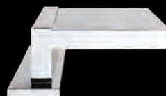
BOCCA DI EROGAZIONE A CASCATA BORDO VASCA BATHTUB WATERFALL SPOUT